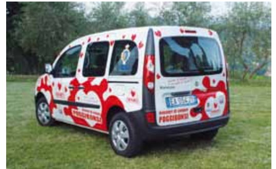
Nuovo automezzo Fratres.