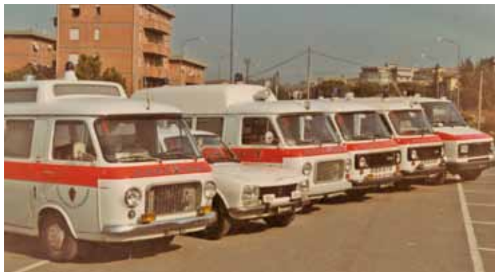
Un vecchio parco auto della Mise.