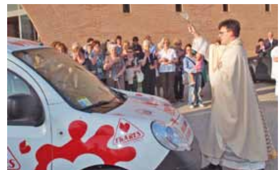
Don Alessandro benedice l’automezzo.