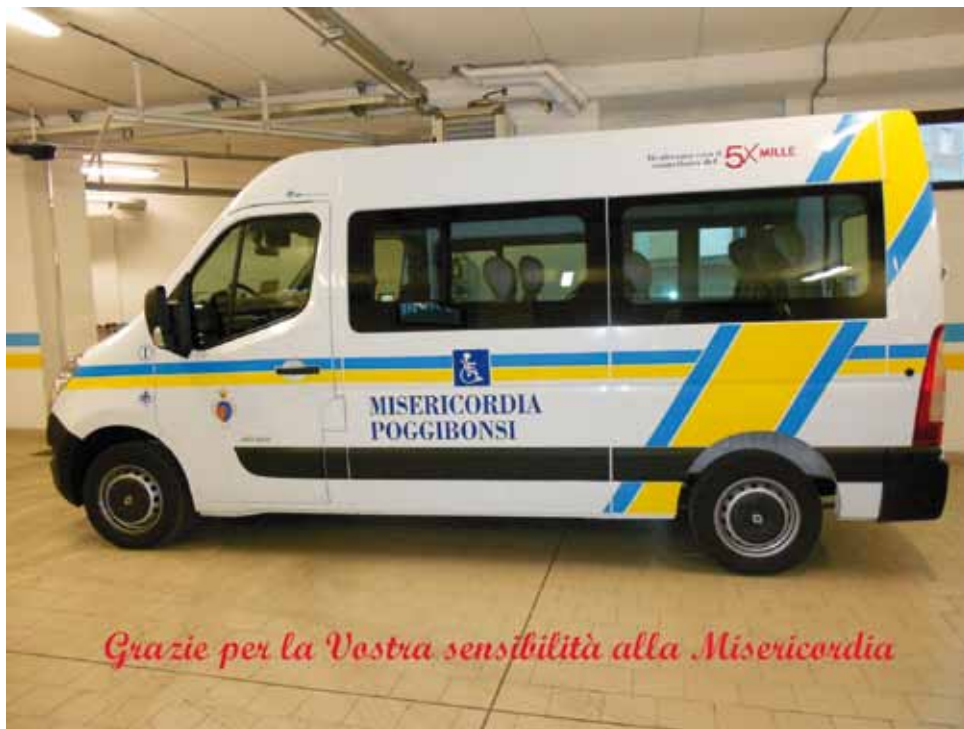
Grazie per la Vostra sensibilità alla Misericordia