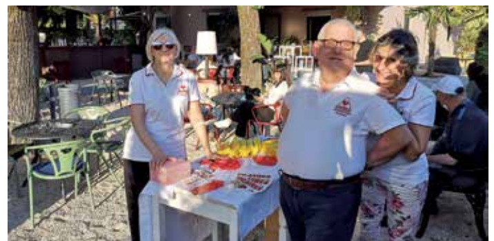
Aperifratres al G&B Garden