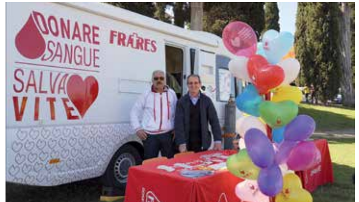
Con i Fratres alla Festa del Patrono San Lucchese