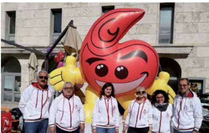
In piazza con i Fratres a Sbaraccando