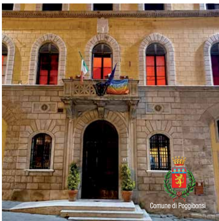
Comune di Poggibonsi